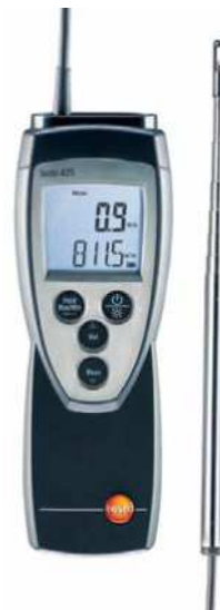
Şekil 10. Sıcak Telli Hızölçer (Anemometre)[2]