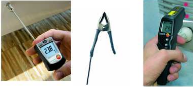
Şekil 4. Boru Yüzeyinden Sıcaklık Ölçümü.

Temassız termometreler ise çok hızlı ölçüm yapabilmektedirler. Bu cihazlarda kullanma kılavuzlarında belirtilen optik orana dikkat ederek, cihazı borunun sıcaklığını ölçecek mesafeye getirip ölçüm yapılmalıdır. Ayrıca, temassız termometrelerle parlak yüzeylerden ölçüm alınmamalı ve mümkünse parlak yüzeyler mat hale getirilmelidir. Ancak basma ve genişleme hatlarında boru dışından yapılan ölçümlerde 4-6 °C fark olduğu unutulmamalıdır.