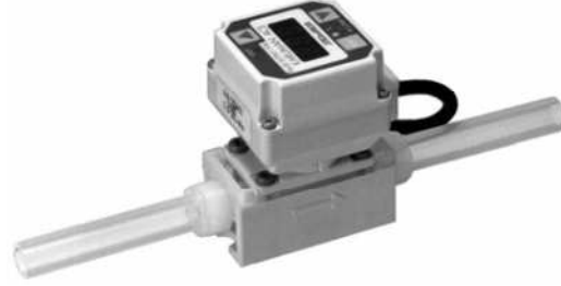
Şekil 6. Vorteks Tipi Debimetre [5]