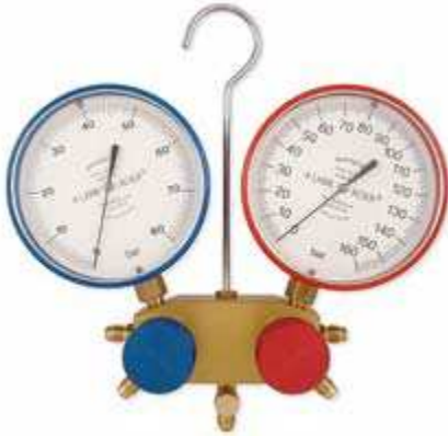
Şekil 2. Analog Manifold

Basınç ölçümü manifoldlarla yapılmaktadır. Piyasada dijital ve analog olarak iki farklı çeşitte manifold bulunabilir. Analog manifold kullanılırken sistemdeki soğutkana ait değerleri içeren manifold kullanılmalıdır. Dijital manifold kullanılıyorsa, ölçümden önce ilgili akışkan tipi ekrandan seçilmelidir. Manifoldlar kullanarak seçilen akışkanın ölçülen basınçtaki doyma sıcaklıklarına ulaşılabilir. Doyma sıcaklığı akışkanın söz konusu basınç altındaki buharlaşma /yoğuşma noktasını ifade eder.