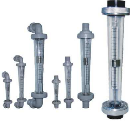
Şekil 5. Şamandıralı Debimetre [4]