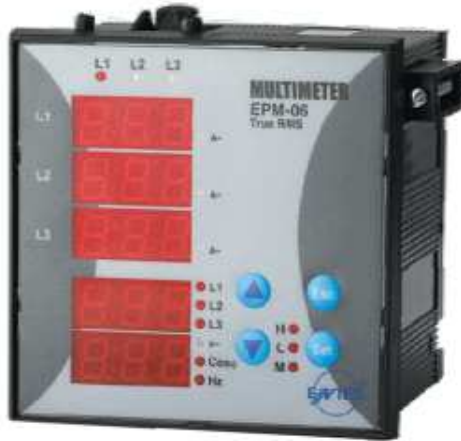
Şekil 12. Multimetre (Akım, Gerilim, Frekans ve Güç Katsayısı) [9]

Bu ölçüm cihazlarına örnek olarak avometreler, multimetreler (Şekil 12), şebeke ve güç analizörleri (Şekil 13) verilebilir.