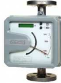
Şekil 8. İbrelili Metal Gövdeli Debimetre [7]