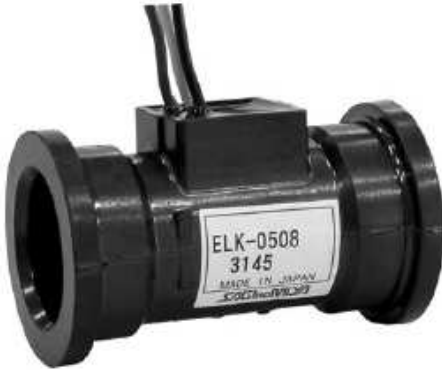
Şekil 7. Türbin Tipi Debimetre [6]