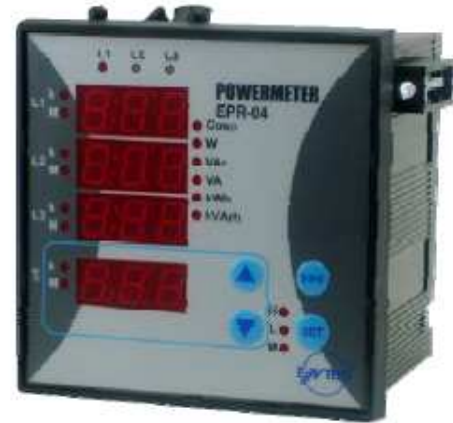
Şekil 13. Güç Analizörü [10]