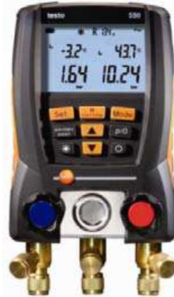
Şekil 3. Dijital Manifold