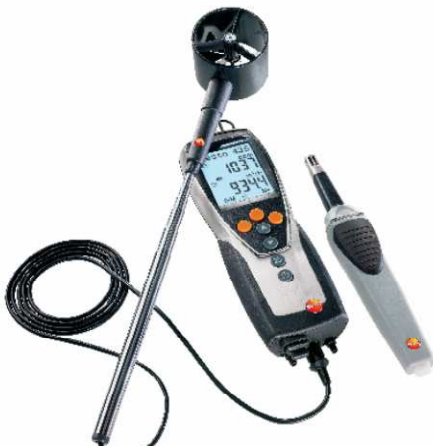
Şekil 9. Pervaneli Hızölçer (Anemometre) [2]

Hava hızı ölçerler genelde pervaneli (Şekil 9), sıcak telli (Şekil 10) ve pitot tüpü (Şekil 11) prensibi ile çalışırlar. Özellikle hava soğutmalı cihazlarda soğutucu akışkan taraflı akış ölçümü yapılamıyorsa kapasite ölçümleri için kondenser/evaporatör yüzeyinden hava hızları ölçülebilir. Ancak bu ölçümlerde yüzeyde gridler oluşturularak ortalama hızın bulunması gerekmektedir.