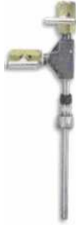
Şekil 11. Pitot Tüpü [8]