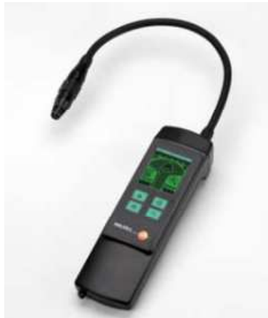
Şekil 14. Elektronik Kaçak Detektörü

Soğutma sistemindeki soğutkan miktarının normalden az veya fazla olması verimliliği dolaysız etkilemektedir. Bu nedenle Avrupa Birliği'nde 2006 yılında yürürlüğe giren F-Gas yönetmeliğiyle, içerdikleri soğutkan miktarına bağlı olarak sistemlerin periyodik aralıklarla kaçak testine tabi tutulmaları zorunlu hale gelmiştir. Ülkemizde de benzer yönetmelik çalışmaları yapılmaktadır. Tüm bağlantı noktalarının titizlikle incelenmesi oldukça önemlidir. Tüm bu kontrol işlemlerini yerine getirirken soğutucu akışkanın havadan daha ağır olduğunu unutmamakta yarar vardır.